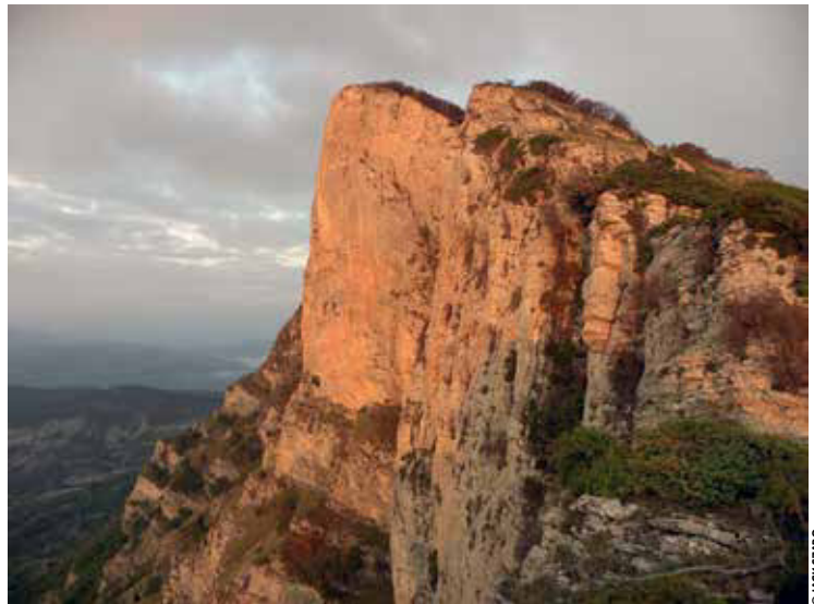
Lever du soleil sur Roche Rousse

Les deux autres équipes avaient pour cadre de leur mission le secteur Les Girards – La Laveuse – Roche Mottet pour l'une, et Le Pas de l'Estaing pour l'autre.