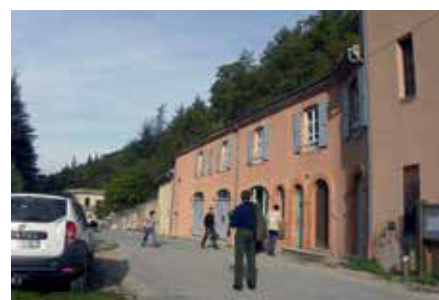
De retour au bureau des gardes