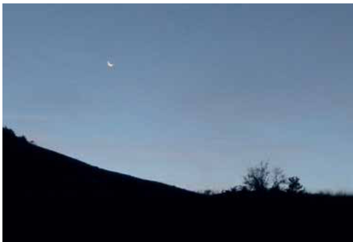
Dernier quartier de lune au Pas de Siara

Moment d'intense émotion pour le presque « naïf » que j'étais (je m'étais un peu échauffé le dimanche précédent lors de la journée d'observation organisée par Babette et la FRAPNA à Sainte-Eulalie-en-Royans) car c'était la première fois que je participais à une observation scientifique. En effet, au-delà du nombre d'individus, il s'agissait aussi d'en identifier le sexe pour les adultes, et de différencier les cabris de l'an-